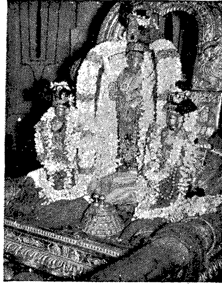
ஸ்ரீ காஞ்சீ தேவப்பெருமாள்.